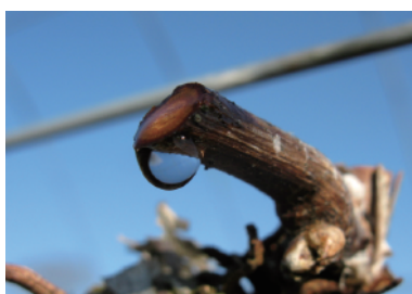
ぶどうの樹液流動