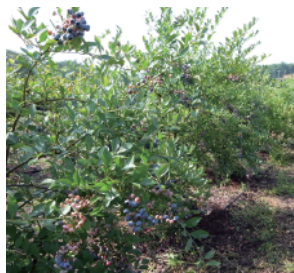
たわわに実ったラビットアイ系

ブッシュ(早生のスパータン)を接木(高接ぎ)した樹に実がなりました。大粒で見栄えもよく美味しいです。しかし、この時期はぶどうの作業がいちばん忙しくなかなか手