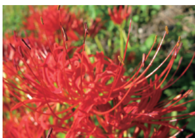
道端で咲く彼岸花

出発。真っ暗な道を登るにつれて酸素が薄くなり高山病(山酔いで頭痛や吐き気がする)で、リタイアする子供が続出。さらに真冬なみの寒さと眠たさも加わり、9合目で娘も限界だったとか。でも「なにが何でも頂上に行ってやる」と心に誓い、3976mのてっぺんで、まっ赤な御来光を拝めたようです。どんなにしんどくても、あきらめずに頑張り抜けた、この体験は大きな自信になったでしょう。素敵なチャレンジをさせてくれた、おが町がまた好きになりました。(残念ながら娘は山ガールにはならないようです。トホホ)