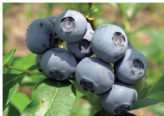
接木になった果実

ブッシュ(早生のスパータン)を接木(高接ぎ)した樹に実がなりました。大粒で見栄えもよく美味しいです。しかし、この時期はぶどうの作業がいちばん忙しくなかなか手