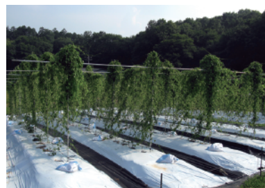
ちょっと寂しい自然薯畑

今年はぶどうの予想外のバタバタで自然薯畑にあまり行くことが出来ず、こまめに茎の誘引が出来なかったからか、今年の種イモがいつもより小さいのが原因か、今年は茎